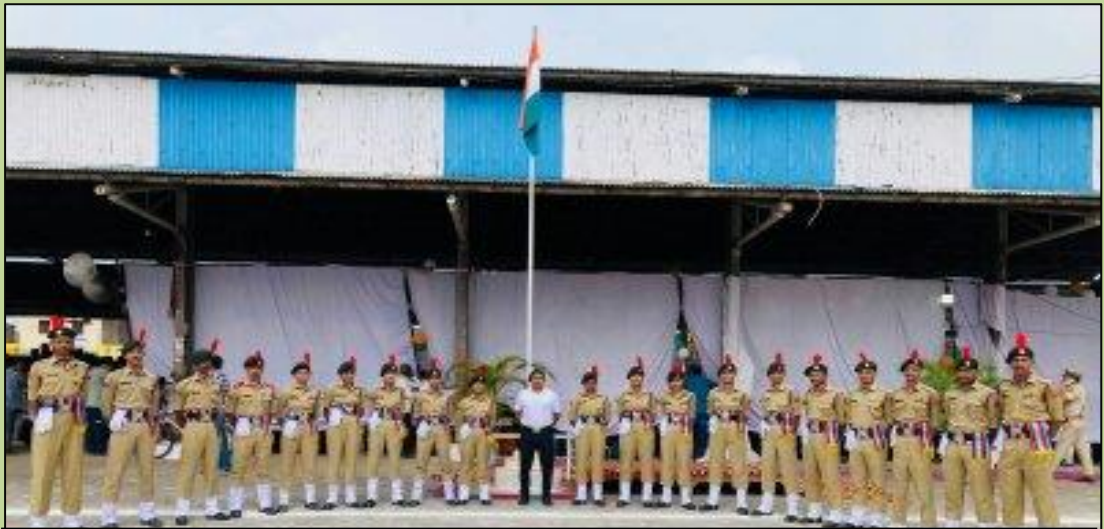
27 NCC Cadets of College have participated in Independence Day Parade (15 August 2023) at New Grain Market, Naraingarh and won 1 st prize.