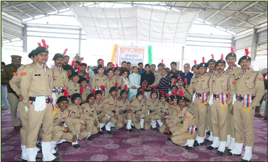
30 NCC Cadets of College have participated in Republic Day Parade (26 January 2024) at New Grain Market, Naraingarh.